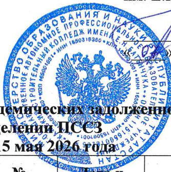
График приема академических задолженностей на отделении ПССЗ с 12 по 15 мая 2026 года